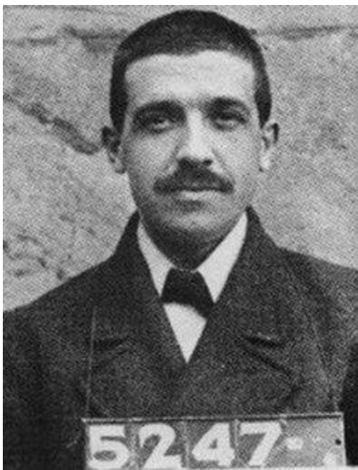
Чарльз Понзи (фото при аресте), 1920 г.

В общей сложности ему удалось обмануть более 17 тысяч вкладчиков. В 1924 г. остатки состояния Чарльза Понзи были предметом тяжбы со стороны некоторых обманутых им инвесторов в Верховном суде США. Расследуя дело, председатель суда Тафт, в частности, обнаружил, что он начинал своё «купонное» предприятие, имея лишь 150 долларов в кармане.