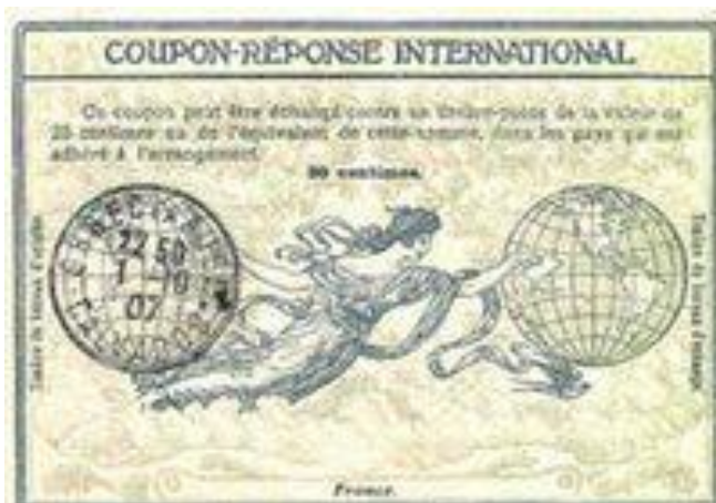
"Рим", 1907 г.

Примечание: Следует отметить, что имело место реализация купонов с датой их продажи уже после срока прекращения действия данной серии (например: "Вена" - в 1967-69 гг., "Токио" - в 1975 г. и др.). Видимо, приведенные случаи были связаны с избыточным их количеством печатания по предварительному заказу в ИВ UPU.