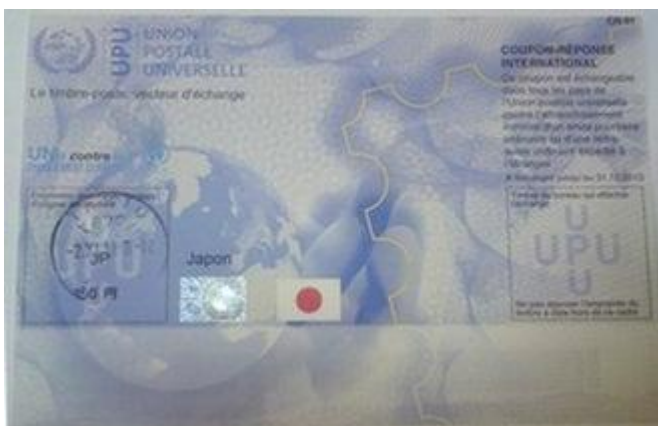
“Найроби”, 17.0.2009 – 31.12.2013.