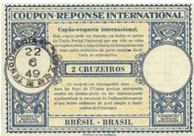
"Лондон", 1949 г.