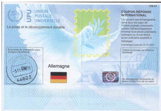
Новый образец (с 1.01.2018)

Идея IRC оказалась плодотворной: многие колониальные державы переняли успешный опыт ВПС и, будучи не в состоянии по разным причинам (в основном, в силу разницы валют метрополии и различных её колоний, зависимых территорий) ввести в рамках своих колониальных империй универсальную почтовую марку или хотя бы унифицировать почтовые тарифы и набор услуг, почты, внедрили альтернативные ответные купоны. Аналогичные проекты реализовывались и странами-членами некоторых региональных почтовых союзов. Правда, не все такие проекты оказались в итоге успешными.