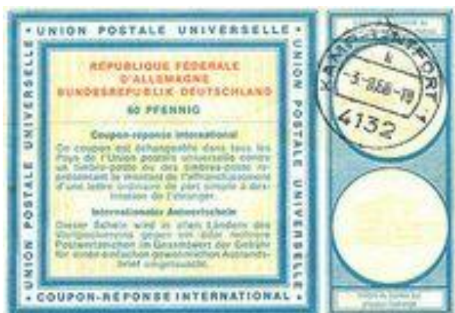
"Вена", 1968 г.