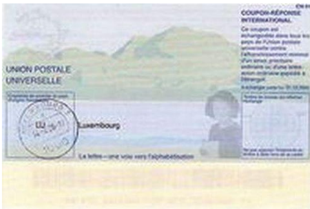
“Пекин”, 2006 г.