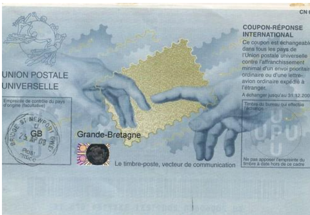
“Пекин”, 2008 г. (Украинский дизайн)