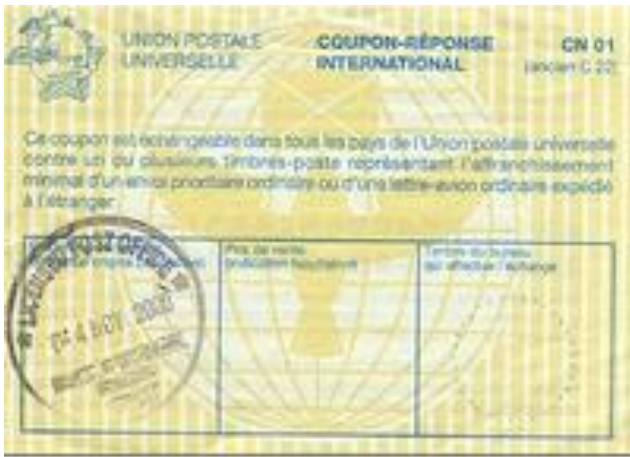
“Лозанна”, 2000 г.