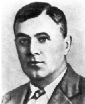
Макс Клаузен. Шанхай. 1930-1931 г.г.

[Примечание: До этого Рихард с Максом лично не был знаком, но знал о нем довольно подробно: моряк из Гамбурга, солдат Первой мировой войны (германский корпус связи на Западном фронте), кузнец, техник, Клаузен род. в феврале 1899 г. на о.Нордштранде, у побережья Шлезвиг-Гольштейна, сменил в жизни десяток различных профессий до того, как стал радистом на германских торговых судах. Первый раз в СССР Клаузен попал в 1927 г., перегоняя в Мурманск трёхмачтовую ихуну, предназначенную для пополнения советского промыслового флота. Позже на другом корабле заходил в Ленинград. В 1928 г. по призыву правительства молодой республики о технической помощи он как иностранный